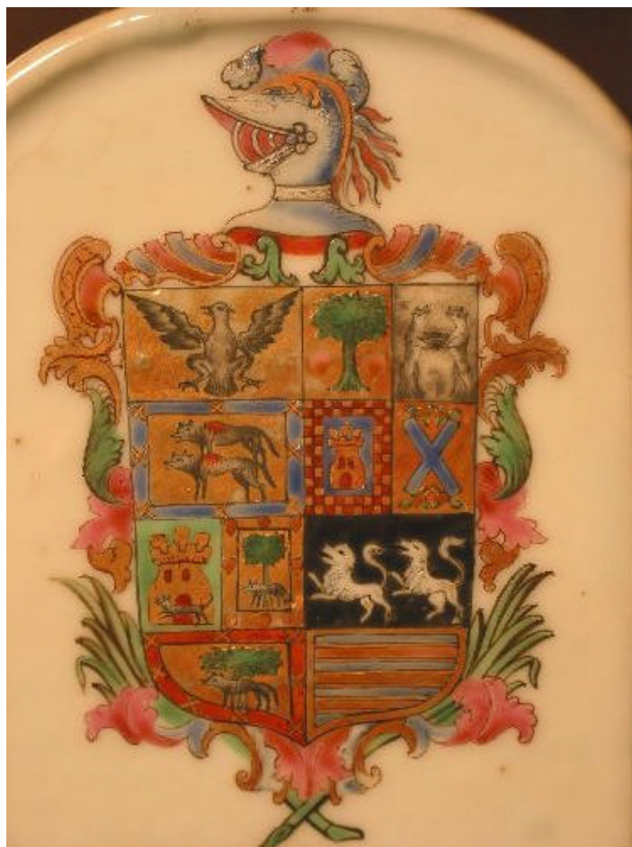
Escudo de los marqueses de Jaral de Berrio. 1

La consumación de la independencia de México no trajo consigo de manera automática el rompimiento con las instituciones heráldicas y nobiliarias del Antiguo Régimen. Quizá no se ha hecho el suficiente énfasis en que el período 1821-1824 constituye un punto de ruptura doble. Las señales revolucionarias y jacobinas que emitió el gobierno español tras el golpe del coronel del Riego en 1820 sirvieron como catalizador de la reacción novohispana. El temor a la pérdida de la primacía del catolicismo mexicano como religión