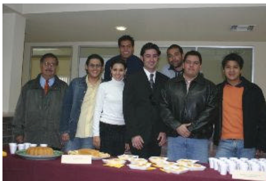
Alumnos de la clase otoño 2005 1

¿Existía en la Comarca Lagunera la costumbre de elaborar recetarios? Es decir: ¿existía la costumbre de poner por escrito los nombres y cantidades de los ingredientes y también los pasos necesarios para confeccionar uno o varios platillos?