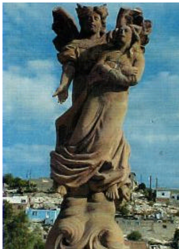
Asunta al cielo por un ángel necróforo

En Torreón, el viejo y céntrico panteón municipal guarda una insospechada riqueza escultórica. Cruces labradas, ángeles extáticos, pétreos divanes, mujeres sollozantes que arrodilladas se abrazan a la cruz mortuoria, áncoras, ángeles necróforos, ramadanes turcos (lunas nuevas y estrellas de cantera) y mil motivos más.