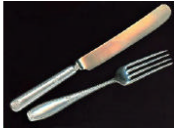
Cubiertos de mesa. Segunda década del siglo xx.

el uso de artefactos hechos ad hoc para el acto de comer y que las clases influyentes pusieron “de moda” en diversas épocas y lugares.