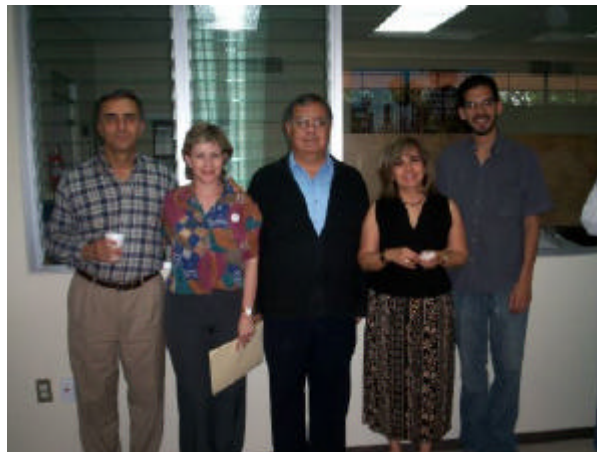
Algunos aspectos del brindis por la centésima edición del Mensajero