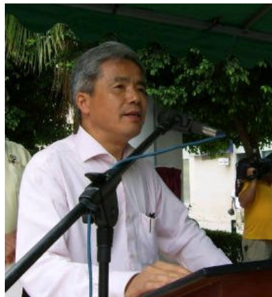
Presidió el acto el Exmo. Embajador de la República Popular China, señor Yin Hengmin 2

A continuación cito el texto al que di lectura como Cronista Oficial de Torreón y orador invitado al acto de desagravio que el Municipio de Torreón, y otras instituciones, organizaron en favor de los ciudadanos torreonenses de origen chino que murieron el 15 de mayo de 1911.