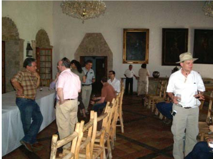
Degustación en la Hacienda de San Lorenzo (Casa Madero) de Parras