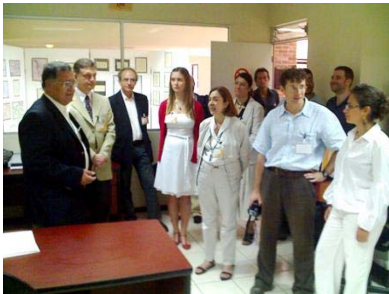
En el Centro de Investigaciones Históricas de la UIA-Torreón